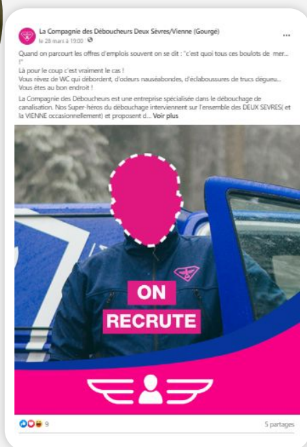
Post de Raphaël